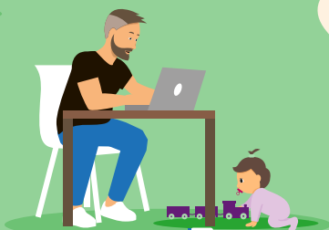
Meer of minder werken