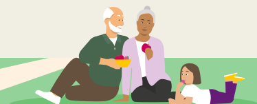
Bijna met pensioen