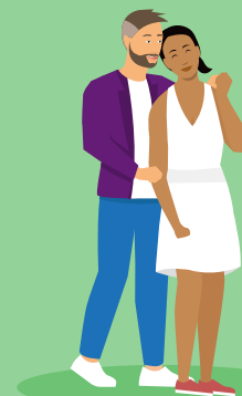
Samenwonen of trouwen