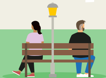
Uit elkaar gaan

Nieuwe baan of een nieuwe woning? Of ga je meer of minder werken? Deze veranderingen hebben vaak ook invloed op je pensioen. Klik op + en lees waar je aan moet denken en wat je nu al kunt doen.